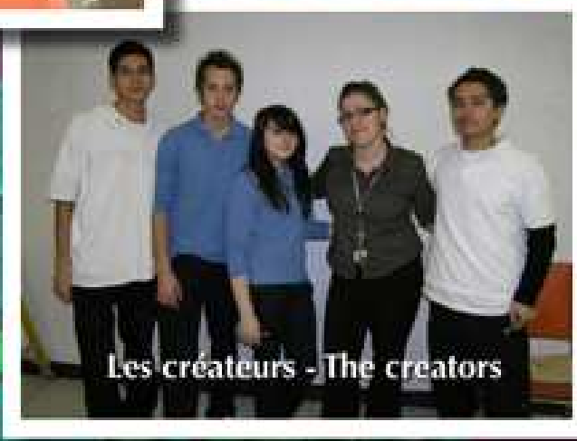
Les créateurs - The creators