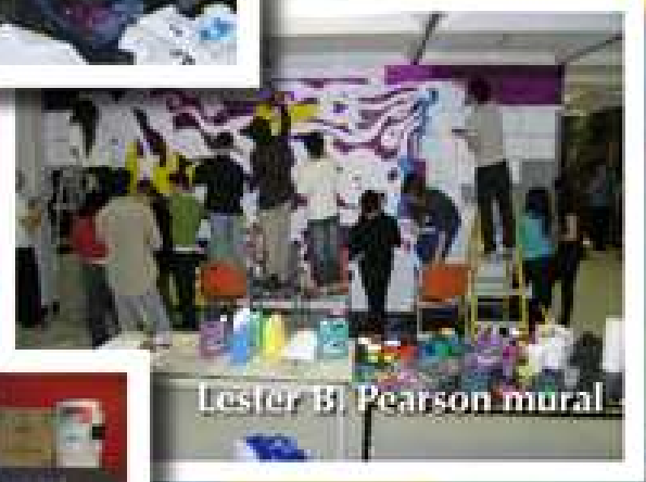
Lester B Pearson mural