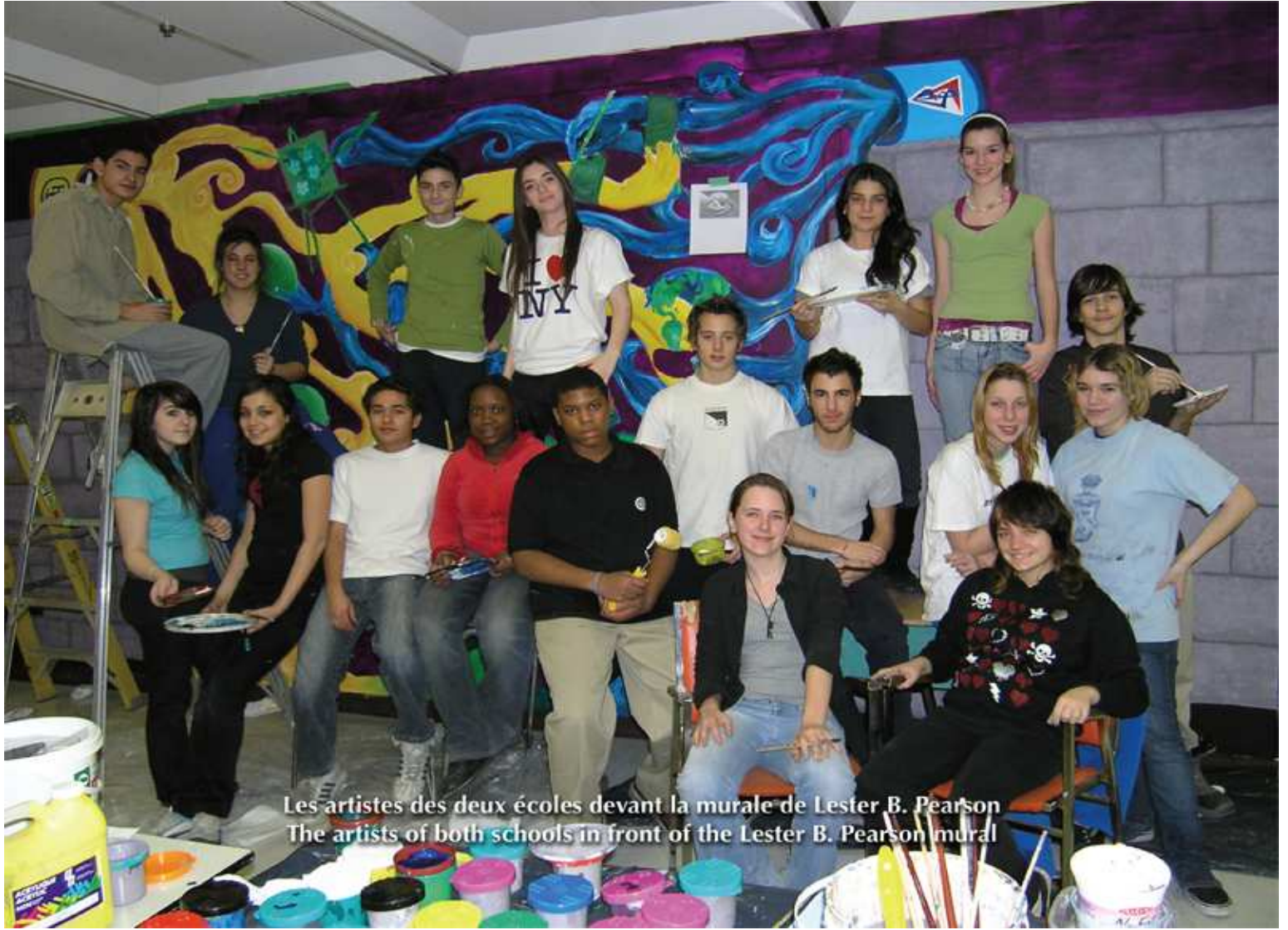
Les artistes des deux écoles devant la murale de Lester B. Pearson The artists of both schools in front of the Lester B. Pearson mural