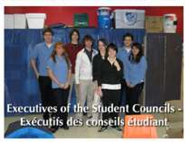
Executives of the Student Councils - Exécutifs des conseils étudiant